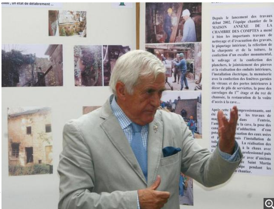
En septembre 2014, lors de l'inauguration de la Maison des Comptes, rue Renarderie, à Vendôme.